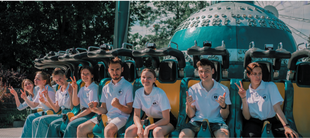
Диво Остров порадовал

Столько активных, амбициозных и трудолюбивых людей собрались в одном месте! В составе студенческой команды были представлены почти все общественные структуры университета: студенческий медиацентр, профком, танцевальные студии "eMotion", "Mix Crew" и "Latina", спортклуб "Атлант", академический хор, вокальная студия, оркестр, творческая команда "Народная мозаика", художественная студия "Свой штрих", волонтеры МГМСУ, победители конкурса Мисс и Мистер МГМСУ 2020 и 2022, СНО и театральная студия "Пломбир".