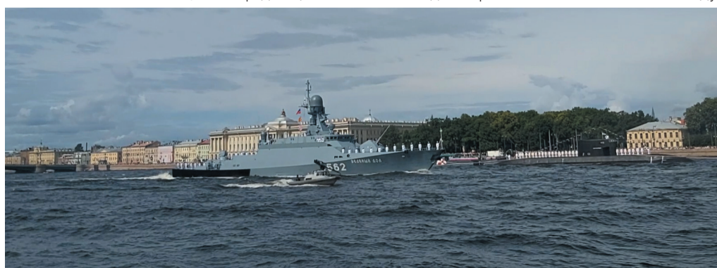
В дни нашего пребывания Питер готовился к параду ВМФ