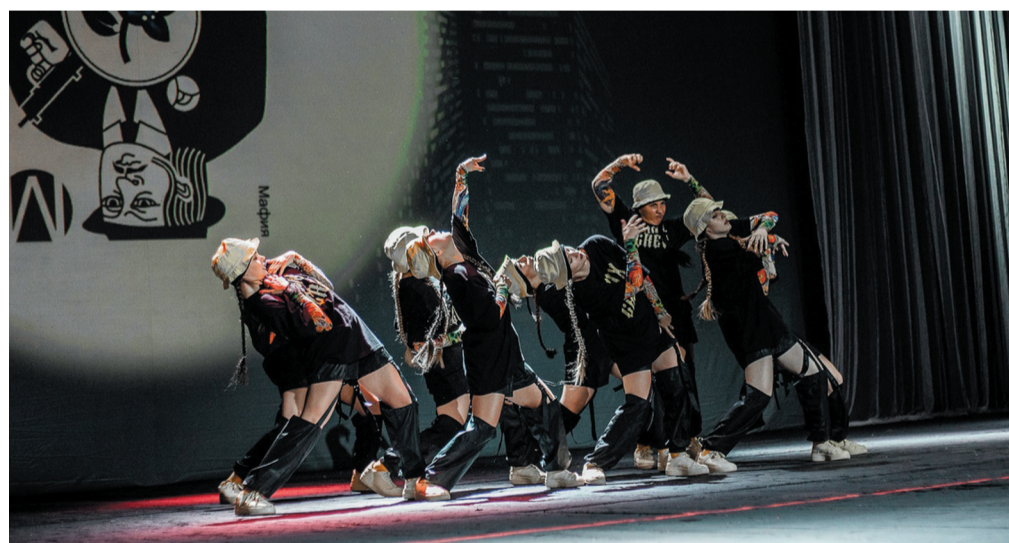
Выступает танцевальный коллектив Mix Crew