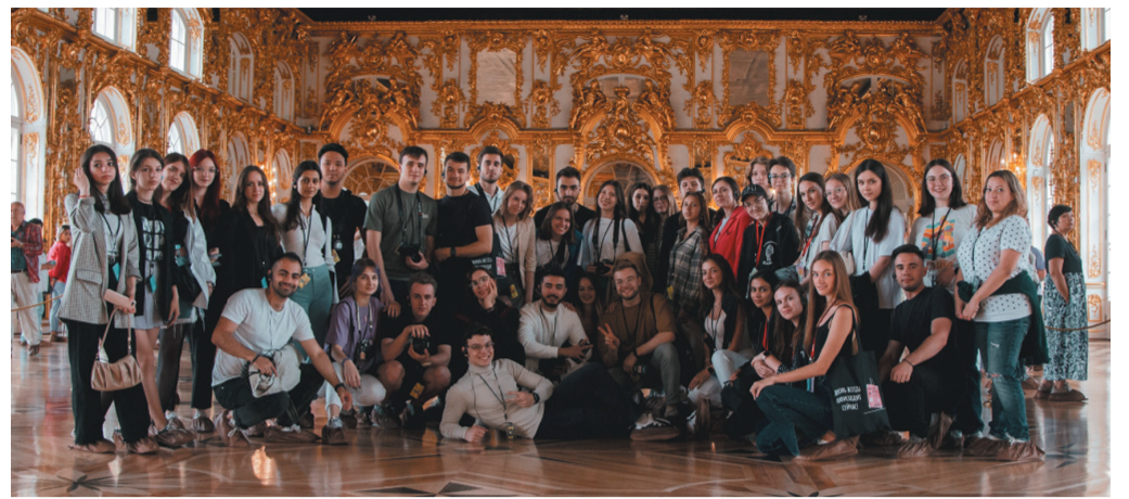
Царское Село. В Большом зале Екатерининского дворца

Вечером ребята приступили к выполнению командных заданий. Поиск и определение новых локаций, необычных материалов для костюмов и реквизита – чего стоили одни декорации для фильмов! Каждый из участников команд мог