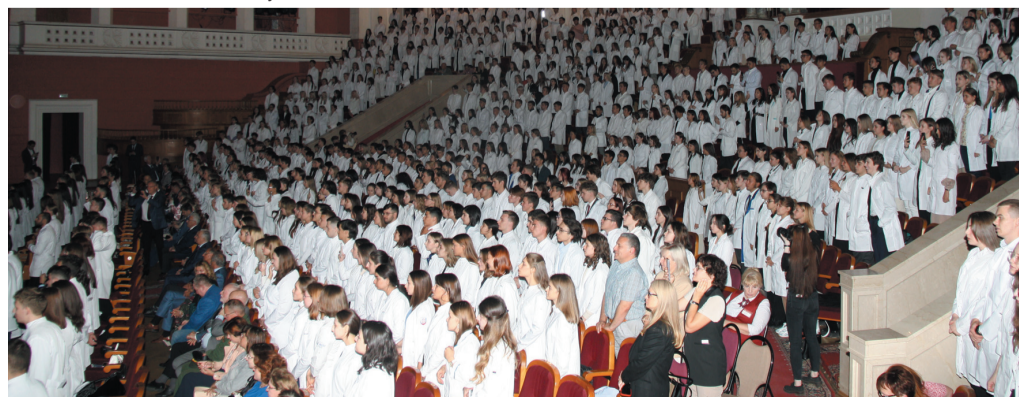
Первокурсники облачились в белые халаты