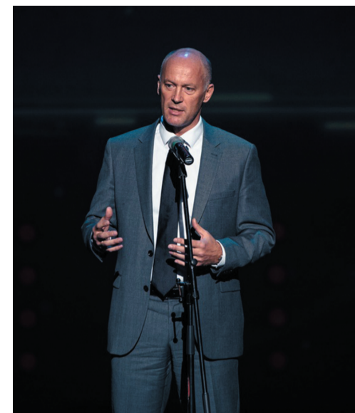
Первый заместитель министра здравоохранения РФ В.С. Фисенко