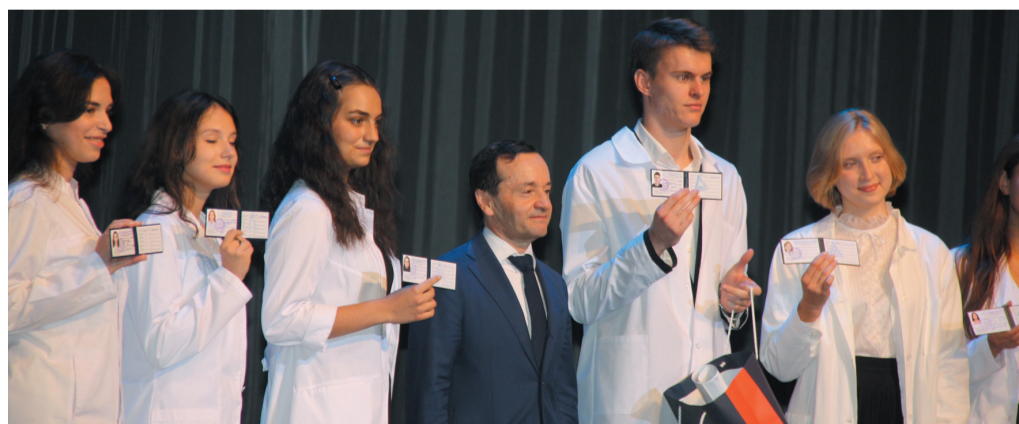
Счастливые обладатели студенческих билетов