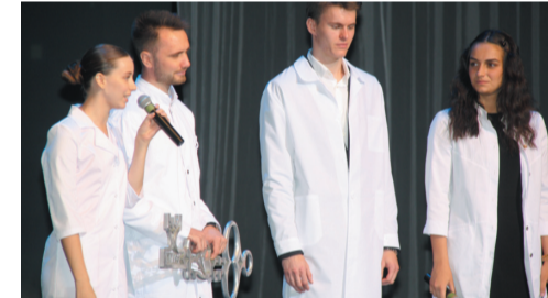
"Ключ знаний" передается от выпускников первокурсникам