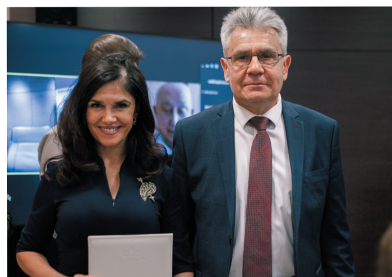
Президент РАН А.М. Сергеев вручает диплом академика РАН О.М. Драпкиной