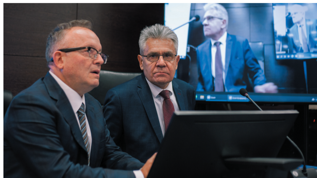
Заседание Академического совета открыл ректор МГМСУ, академик РАН О.О. Янушевич