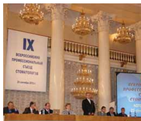
В президиуме съезда

Съездом путем открытого голосования единогласно была принята резолюция.