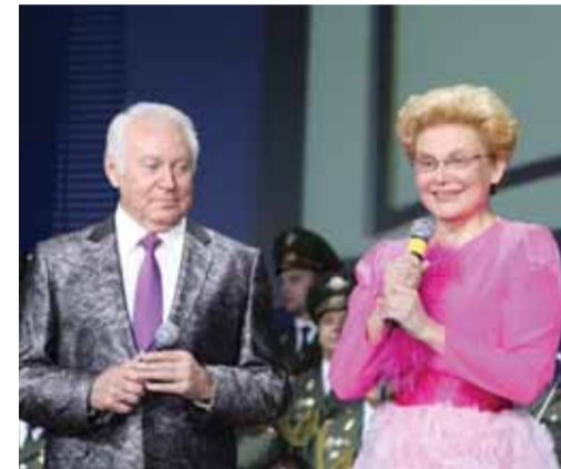
Засл. артист России Е. Кочергин и Е. Мальшева