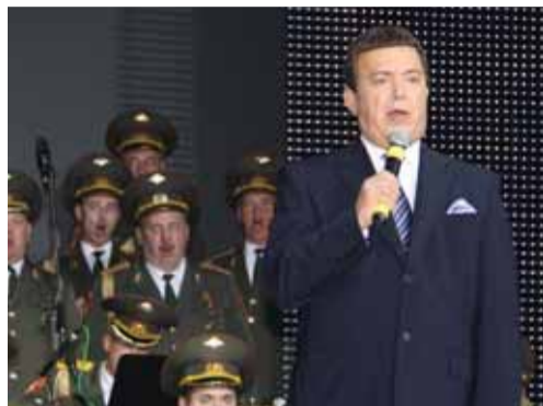
Поэт И. Кобзон в сопровождении Ансамбля песни и пляски Российской Армии им. А.В. Александрова