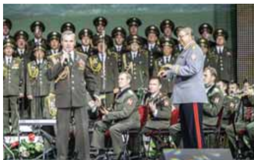
Выступает Ансамбль песни и пляски Внутренних войск МВД РФ