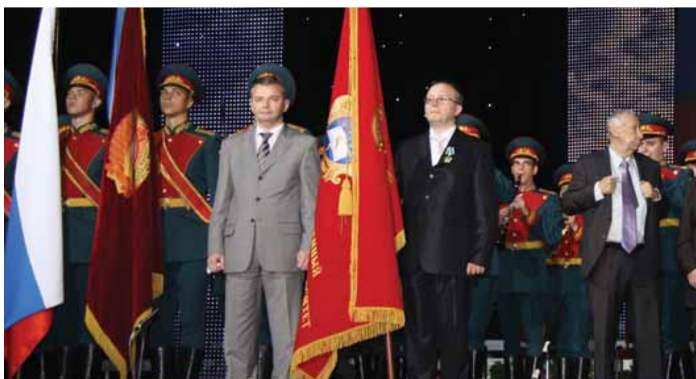
Утверждено новое знамя МГМСУ им. А.И. Евдокимова