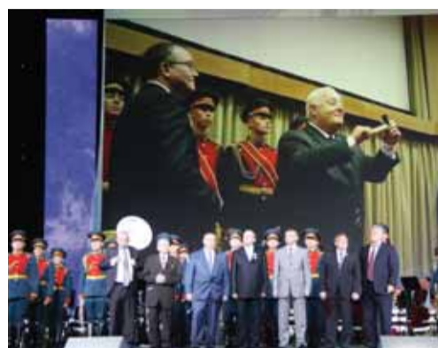
Представление церемонии прикрепления к древку нового знамени МГМСУ им. А.И. Евдокимова