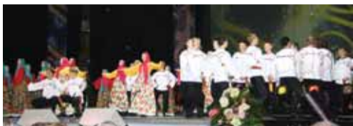
На сцене участники коллектива Государственного академического русского народного хора им. М.Е. Пятницкого