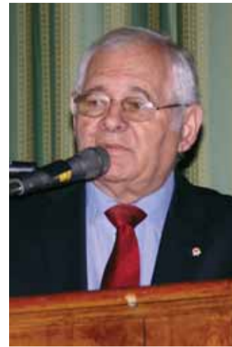
На съезде СтАР выступает Л.М. Рошаль