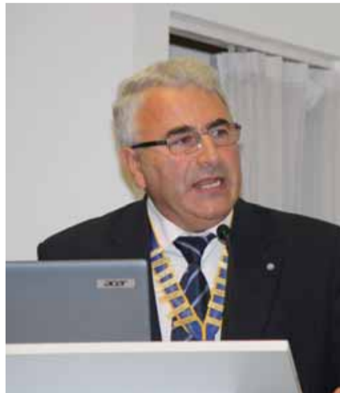
Выступает президент EFAAD проф. С.А. Рабинович (Россия)