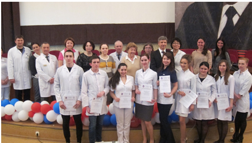
4. На Дне Науки - 2015