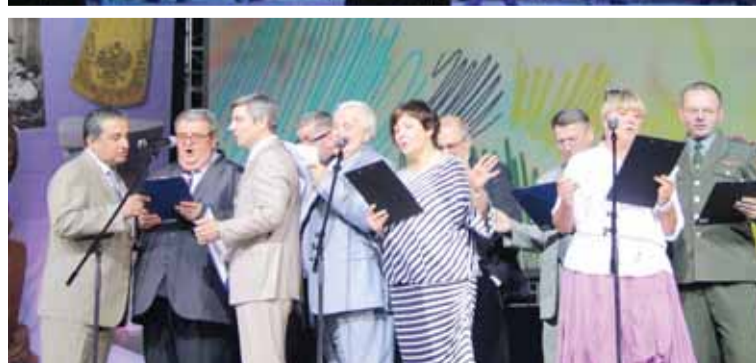
Вокальное поздравление деканов факультетов