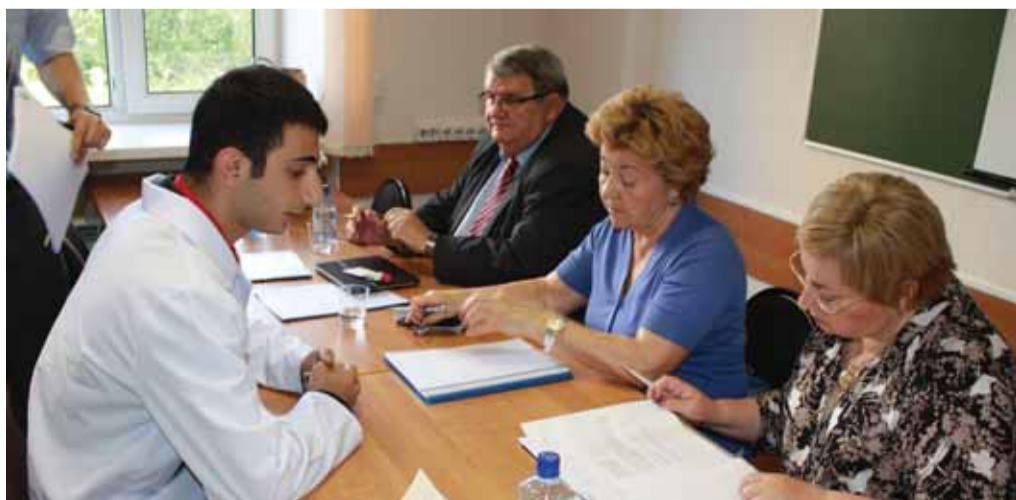
Ведущие преподаватели МГМСУ, входящие в состав государственных экзаменационных комиссий, проводят итоговые собеседования