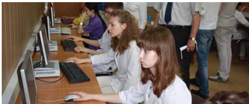
Во время аттестационного тестирования