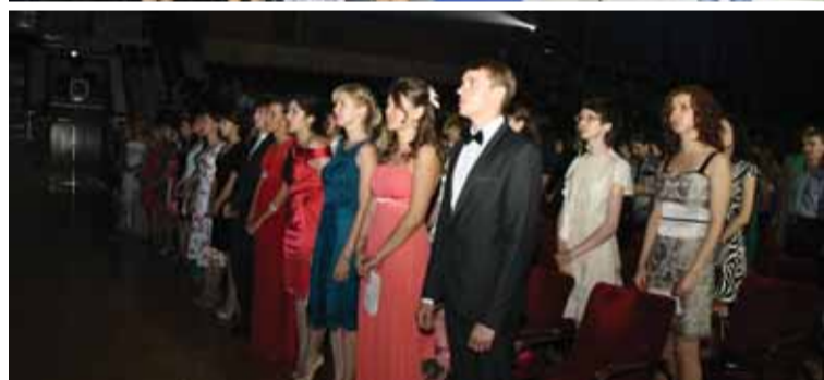
Торжественное произнесение выпускниками Клятвы Врача