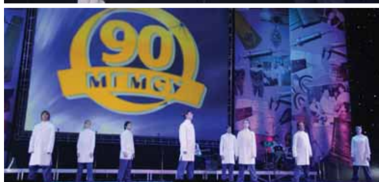
Выпускной бал проходил в знаменательный для МГМСУ год 90-летия университета