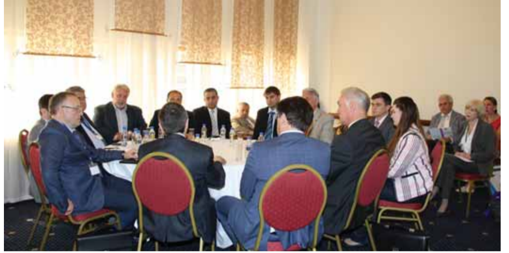
За круглым столом