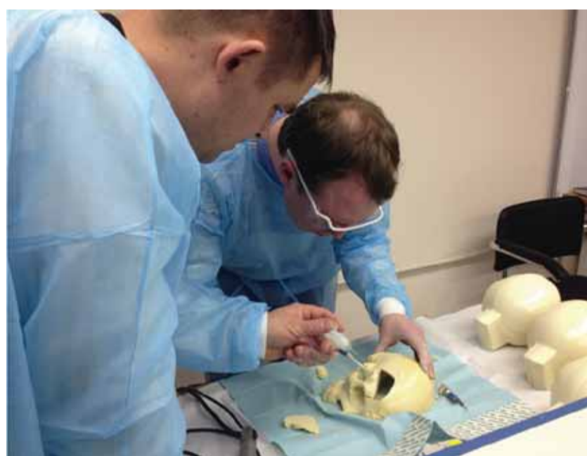
Отработка навыков краниотомии на пластиковых моделях