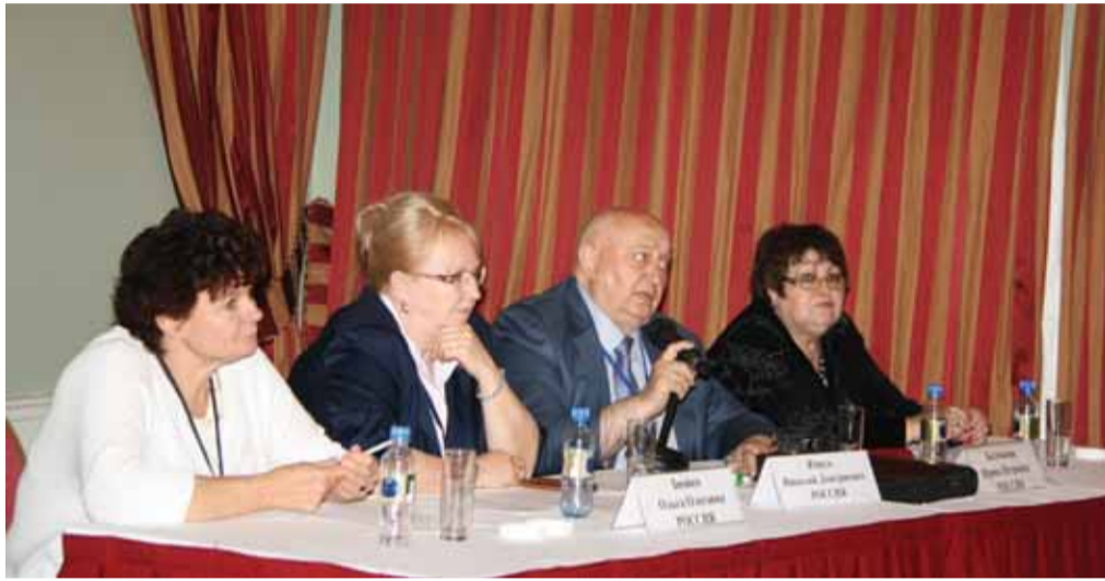
На секции "Молекулярно-генетические исследования в клинике инфекционных болезней"