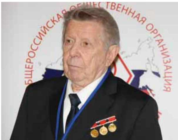
Почетный президент Общества врачей России, академик Е.И. Чазов

Репортажи о праздничных событиях 5–8 мая 2015 г., подготовленные Студенческим пресс-центром МГМСУ – на с. 2–3.