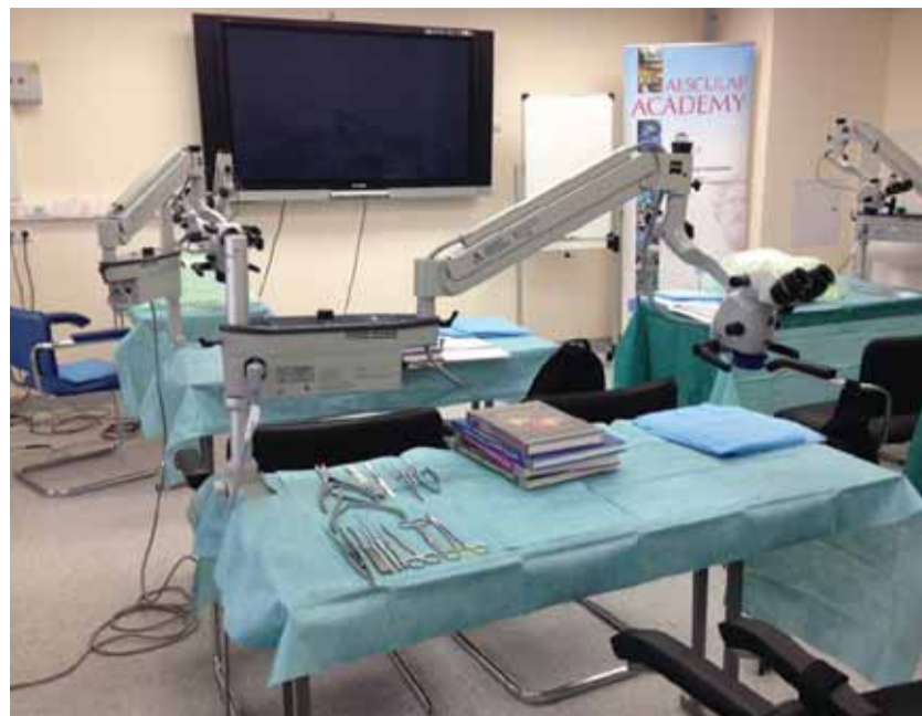
Обучающий класс в Университетской клинике