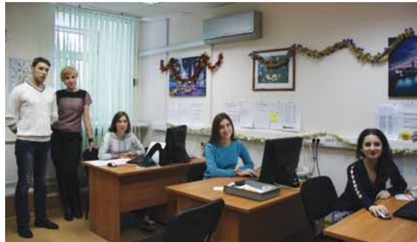
Студенческое бюро всегда придет на помощь