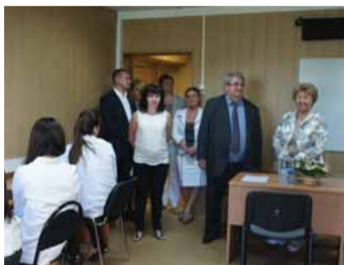
На этапе аттестационного тестирования