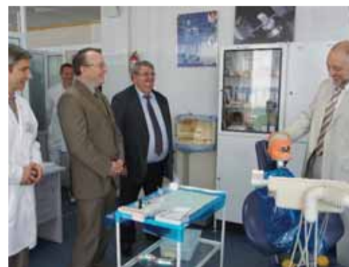
Фантом готов к проверке знаний студентов