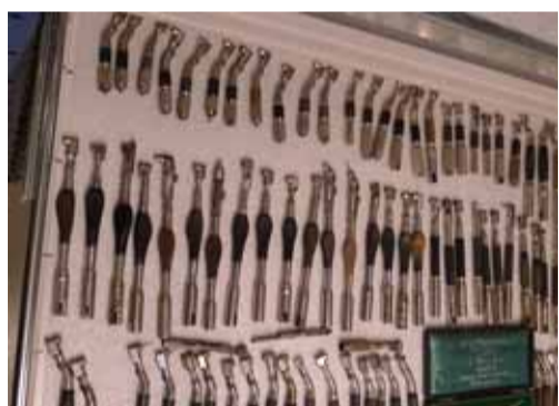
Коллекция наконечников для бормашины