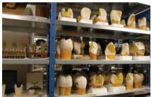
Коллекция зубочелюстных аномалий