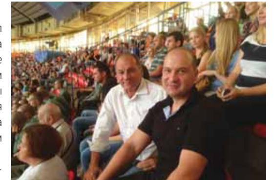
На трибуне большой спортивной арены "Лужников" — главного места проведения стартов чемпионата мира

От имени спортивного клуба выражаем благодарность управлению по воспитательной работе за помощь в организации работы волонтеров и посещения студентами чемпионата мира.