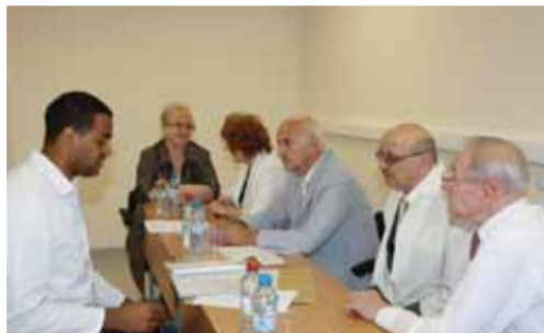
На итоговом тестировании