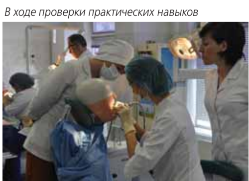
В ходе проверки практических навыков