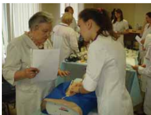
Подготовка к непрямому массажу сердца под контролем профессора И.Г. Бобринской