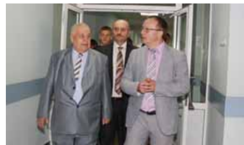
Во время осмотра Медицинского центра МГМСУ им. А.И. Евдокимова