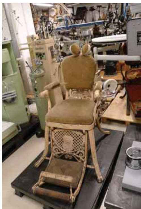
Зубо­вра­че­б­ное кресло XIX века