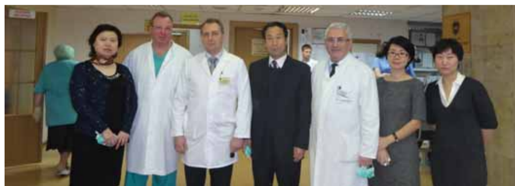
В Центре стоматологии и ЧЛХ МГМСУ

Подписанные соглашения предусматривают, в частности, проведение совместных работ по стоматологии, включая совершенствование программ подготовки медицин-