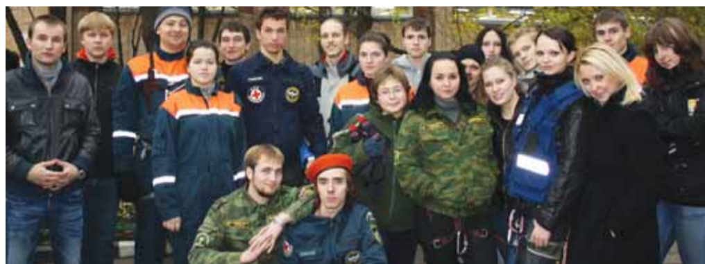
Отряд "Скальпель" на тактико-специальных учениях