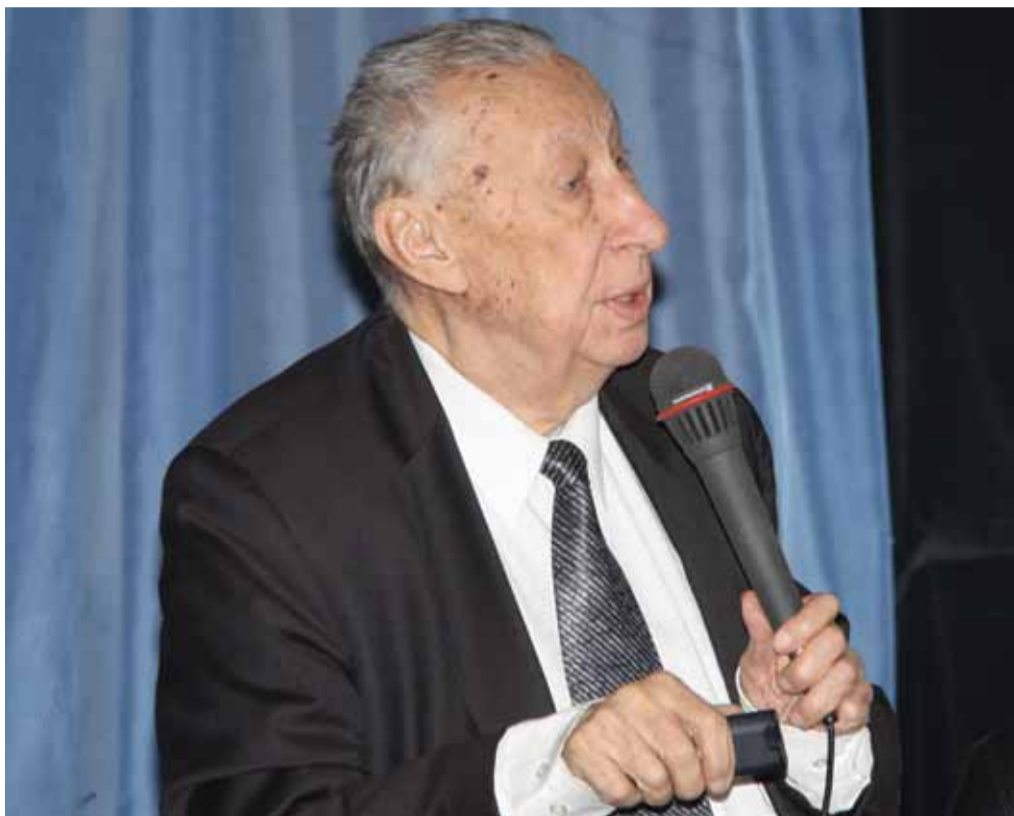
Выступает академик Е.И. Соколов

Прозвучали многочисленные поздравления юбиляру и наилучшие пожелания в его адрес.