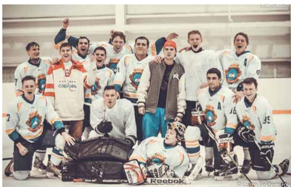
С победой, "Акулы"!