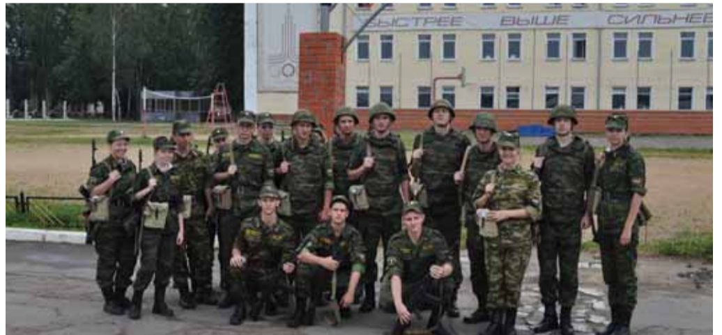
Будущие офицеры на учебном сборе в Нахабино в 2012 г.